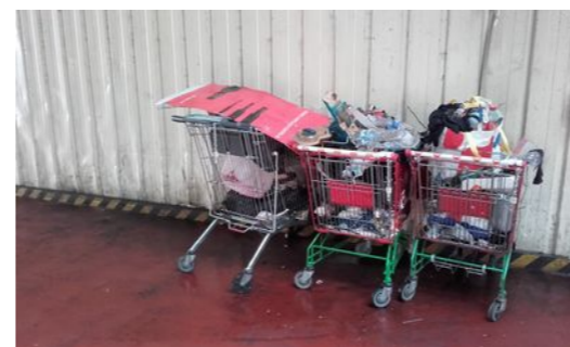
22 avril : évacuation en cours par une habitante avec les caddies

Les habitant.e.s questionnent régulièrement sur l'avenir