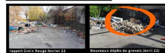
rapport Croix Rouge février 22 La Mouche St Genis Laval

"On voudrait juste une petite aide : évacuer les déchets, la douche, les WC, l'électricité pour la lumière et le frigo."