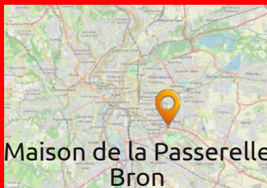
Maison de la Passerelle Bron

Il faut surtout du savoir-faire pour arriver à enfermer la farce dans la feuille de chou. Après il faut les faire cuire dans un bouillon serrés dans une casserole. On peut aussi après les mettre au four !