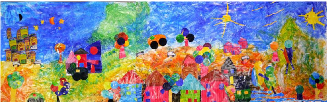
Des couleurs éclatantes en cette fin d'année humide et triste... On ne se lasse pas d'admirer...

Prochaine expo la semaine prochaine vendredi 15 au Toï Toï où vous êtes les bienvenus pour une soirée musicale organisée par la Fanfare à manif' en vue de soutenir les associations qui travaillent au côté des familles sans-abri.